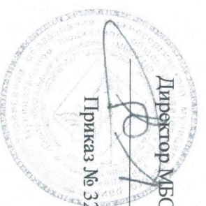
График оценочных процедур МБОУ ЦО «Наследие» с.Шокурово на 2023/24 учебный год